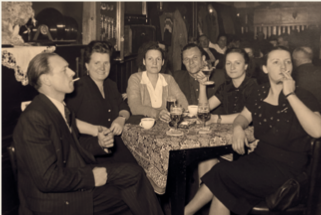
Gaststätte Ensch am Dom in den 50er-Jahren

Ob urige Schankstuben, studentische Treffpunkte oder kultige Szenekneipen – seit Jahrhunderten sind die Trierer Kneipen Orte der Geselligkeit, des Austauschs und des Feierns. Hier treffen sich Studierende, Einheimische und Gäste aus aller Welt; hier entstehen Geschichten, die noch erzählt werden, lange nachdem der letzte Gast gegangen ist. Die Kabinettausstellung des Jungen Beirats erweckt diese Szene mit Interviews, alten Fotos und Artefakten zum Leben. Die Ausstellung nimmt Sie mit auf eine Reise durch die Trierer Kneipenszene: von legendären Adressen vergangener Zeiten über studentische und politische Kneipen bis hin zu den Treffpunkten, die heute das Stadtbild prägen. Entdecken Sie, wie sehr die Kneipen das soziale und kulturelle Leben der ältesten Stadt Deutschlands beeinflusst haben – und warum sie bis heute ein unverzichtbarer Teil des Trierer Alltags sind.