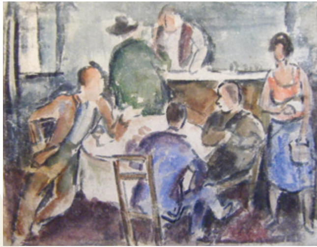
Peter Krisam, »In der Kneipe« (Studie) Aquarell, 1927