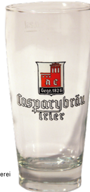
Bierglas der Caspary-Brauerei 20. Jahrhundert

Der Junge Beirat ist das Gremium des Stadtmuseums für Menschen zwischen 16 und 30 Jahren, die sich für die Arbeit im Museum interessieren. Die Gruppe trifft sich regelmäßig und setzt eigene Projekte um. Zweimal im Jahr findet eine Beiratssitzung statt, bei der verschiedene Themen des Museums diskutiert werden. Der Beirat berät das Team des Museums, gibt Feedback und bringt Ideen ein. Du möchtest auch mitmachen? Bewirb dich jetzt für die nächste Runde unter stadtmuseum@trier.de .