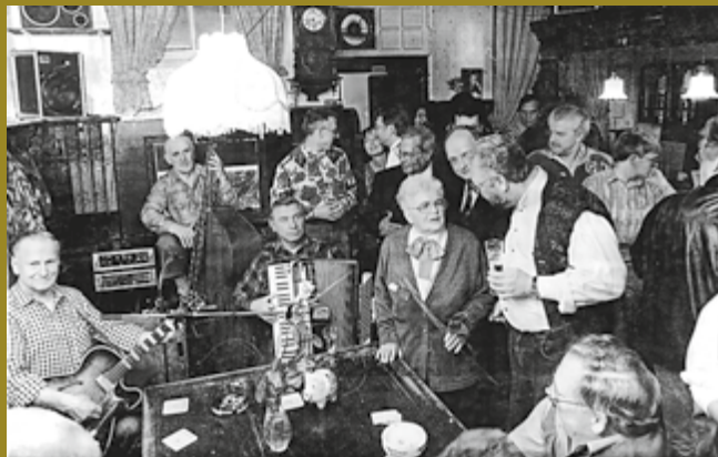
Letzter Abend bei Mutti Krause in der Hosenstraße 1995

Donnerstag, 15. Oktober, 18 Uhr | Eintritt: 8 €