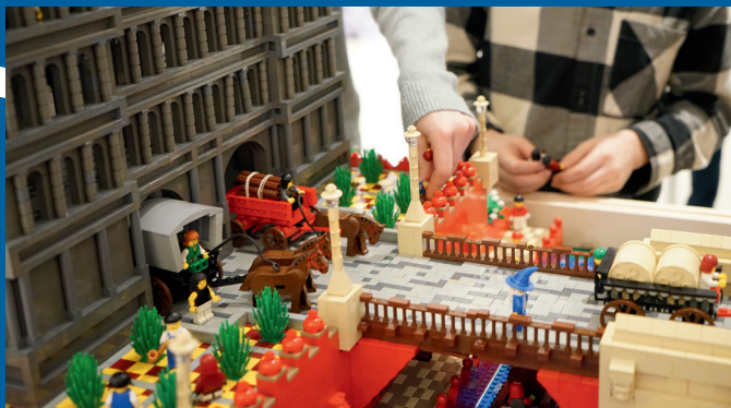
Römerbrücke, Trier