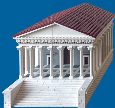
Kapitolstempel, Köln