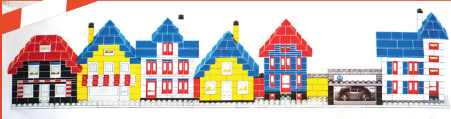
Das große Lego®-Buch, 1969