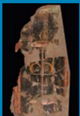
Römische Wandmalerei im Rheinischen Landesmuseum Trier.