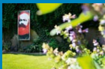
Blick in den Garten des Karl-Marx-Hauses, ©Linda Blatzek/ Karl-Marx-Haus.