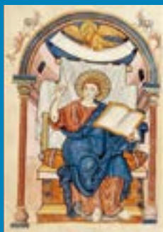
Miniatur aus dem Ada Evangelium: Evangelist Johannes.