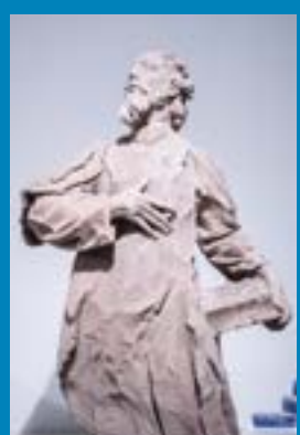
Statue des Heiligen Simeon, 1746, © Stadtmuseum Simeonstift.