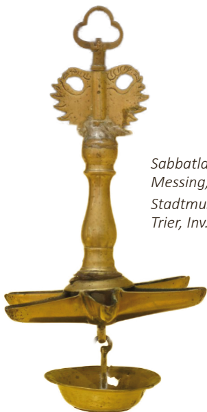
Sabbatlampe, Messing, 19. Jh. Stadtmuseum Simeonstift Trier, Inv.-Nr. X 724