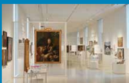
Blick in die Sonderausstellung „Tell Me More. Bilder erzählen Geschichten“